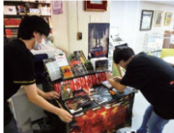
新しい展示づくり(大宮本館)