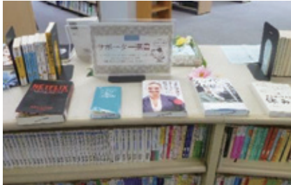
サポーター展示(枚方分館)

ライブラリーサポーターの主な活動内容は、書架整理や配架、定期的に発行される図書館報「ぱびろにくす」に掲載する200字書評への寄稿、図書館で購入する本の選書、選書した本の展示やPOPの作成です。他にもイベントの企画・運営、フリーペーパーの発行、しおりの作成など、各館で様々な活動を行っています。また、活動状況によりアチーブメントシート（業績証明書）が交付されます。