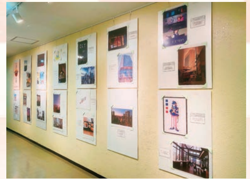
▼写真やイラストなどの応募がありました。