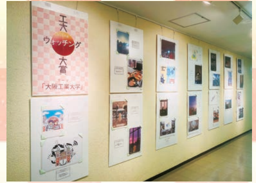
▲ギャラリーにおける展示の様子。2021年1月から2021年7月末まで展示しています。