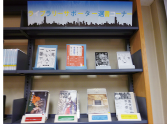
サポーター選書コーナー(大宮本館)