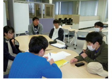
サポーターミーティング(枚方分館)