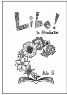
フリーペーパー『Libel!』(左) 大宮 (右) 枚方