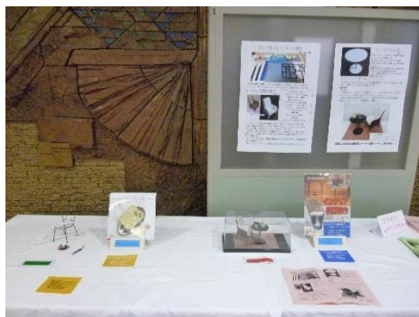
↑本を参考に作った作品展の様子